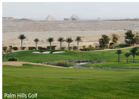
Palm Hills Golf

WICHTIG: Limitierte Anzahl Flugplätze zu oben stehenden Konditionen. Ist die berechnete Buchungskategorie nicht mehr verfügbar, behalten wir uns vor, den Flugzuschlag aufzurechnen. Früh buchen lohnt sich! tb400/0