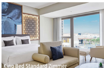
King Bed Standard Zimmer