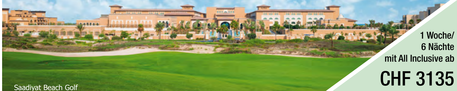
Saadiyat Beach Golf

1 Woche/ 6 Nächte mit All Inclusive ab CHF 3135