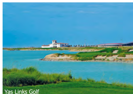
Yas Links Golf