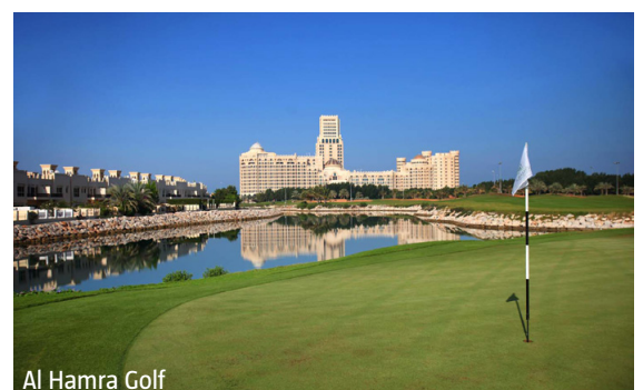
Al Hamra Golf

WICHTIG: Limitierte Anzahl Flugplätze zu oben stehenden Konditionen. Ist die berechnete Buchungskategorie nicht mehr verfügbar, behalten wir uns vor, den Flugzuschlag aufzurechnen. Früh buchen lohnt sich! nl700/0