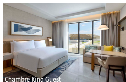
Chambre King Guest

Sport/bien-être: «Eforea» (payant) avec sauna et massages. Des activités nautiques sont proposées à environ 5 km de l'hôtel (en partie par des prestataires locaux). Le terrain de golf Yas Links se trouve à environ 3 km de l'hôtel.