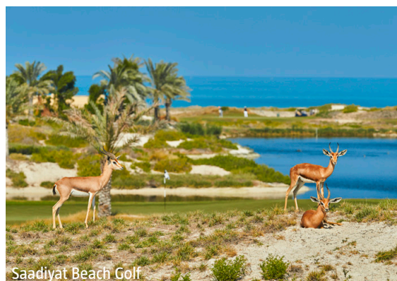
Saadiyat Beach Golf