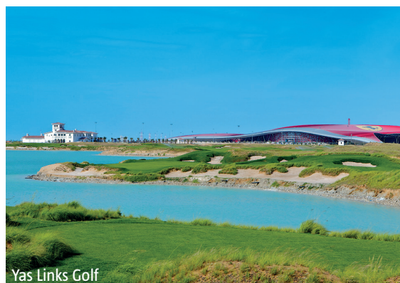
Yas Links Golf