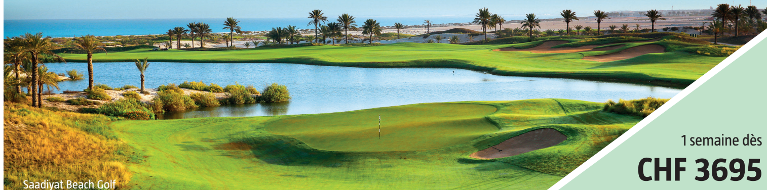
Saadiyat Beach Golf