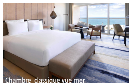
Chambre classique vue mer

Sport/bien-être: Courts de tennis, sports nautiques. Centre de fitness, SPA, bain turc.