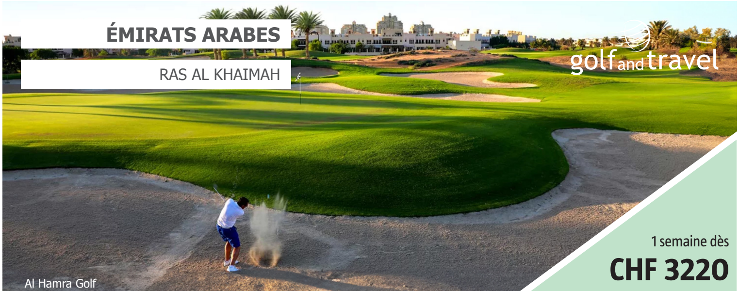
Al Hamra Golf