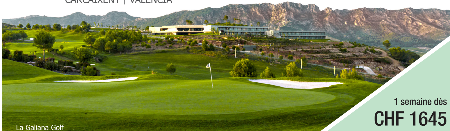
La Galiana Golf