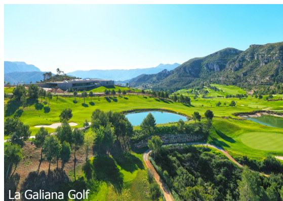
La Galiana Golf