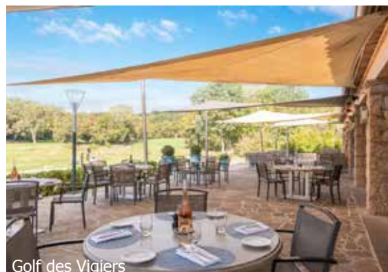
Golf des Vigiers