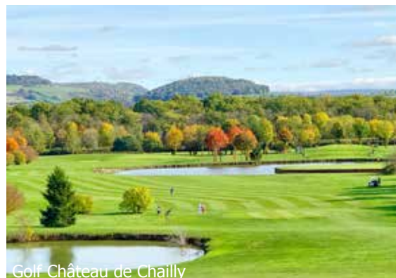
Golf Château de Chailly