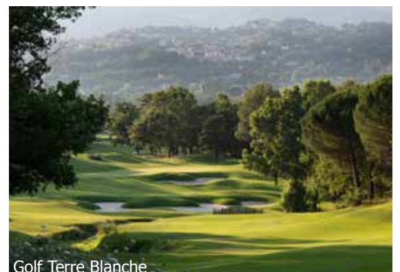
Golf Terre Blanche