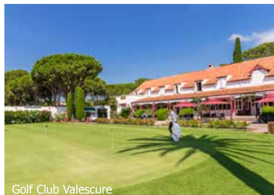
Golf Club Valescure