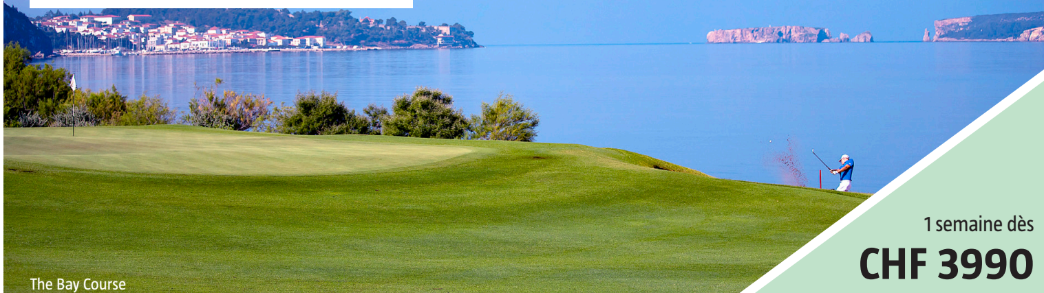
The Bay Course