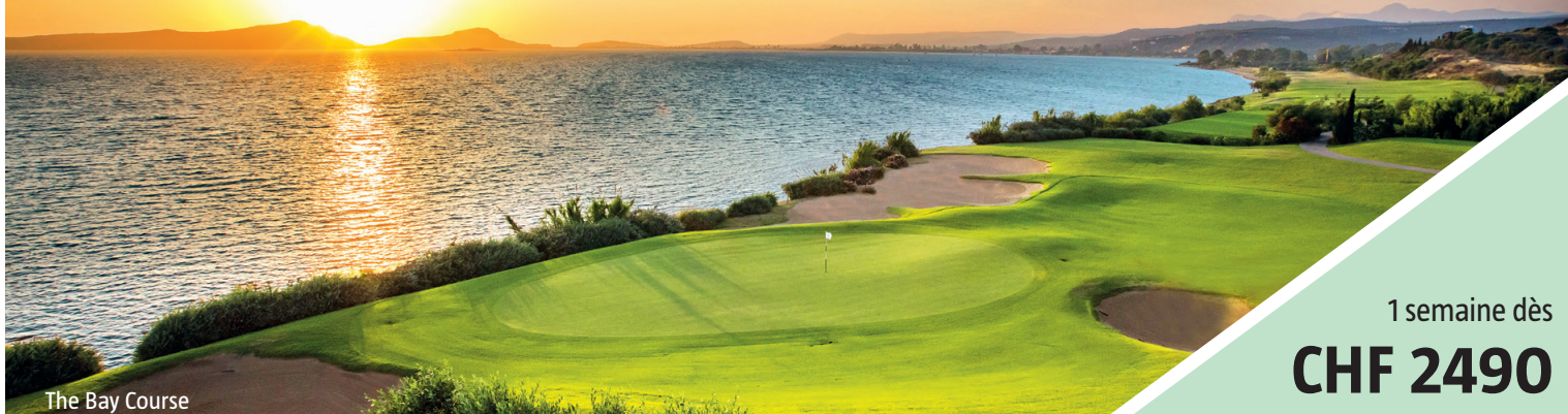
The Bay Course