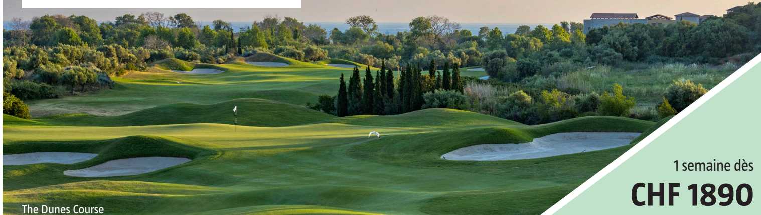
The Dunes Course