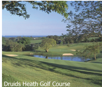
Druids Heath Golf Course

Conçu par Arnold Palmer, ce parcours de 18 trous (par 72, 7211 mètres) est connu pour être l'un des plus spectaculaires d'Europe. Il est régulièrement classé parmi les trois meilleurs parcours de parkland d'Irlande et a accueilli plusieurs tournois majeurs dont la Ryder Cup.