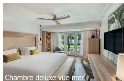
Chambre deluxe vue mer

Chambres: 238 chambres et suites dans le Manoir et des bâtiments de type villa à deux étages. Baignoire ou douche, sèche-cheveux, climatisation, coffre-fort, minibar, nécessaire à thé/café, télévision et balcon/terrasse. Catégories: deluxe Sea View, Premium Sea View, deluxe Beach Front, Premium Beach Front, Suite Premium, Suite Executive Beach Front.