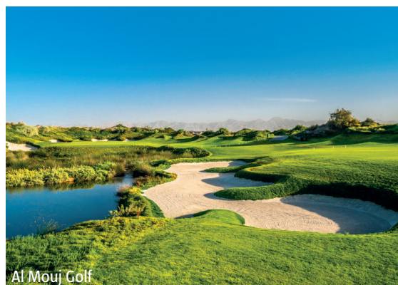
Al Mouj Golf

IMPORTANT: Nombre limité de billets d'avion aux conditions ci-dessus. Si la classe de réservation calculée n'est plus disponible, nous nous réservons le droit d'ajuster une éventuelle surcharge de vol. Réserver de bonne heure vaut la peine! nb850/0