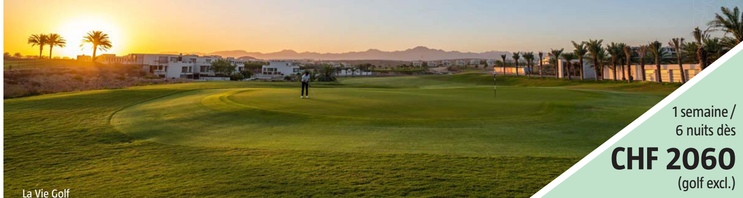
La Vie Golf