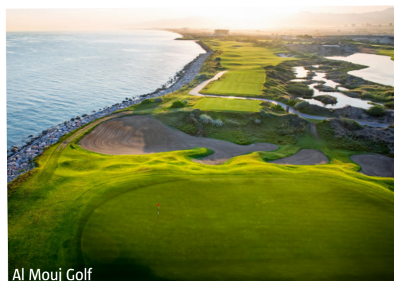
Al Mouj Golf

IMPORTANT: Nombre limité de billets d'avion aux conditions ci-dessus. Si la classe de réservation calculée n'est plus disponible, nous nous réservons le droit d'ajuster une éventuelle surcharge de vol. Réserver de bonne heure vaut la peine! ad850/0