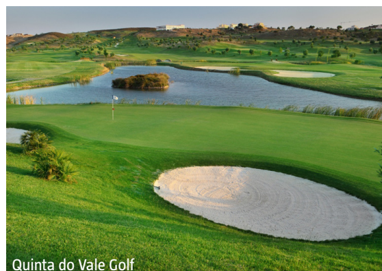
Quinta do Vale Golf