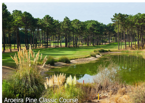
Aroeira Pine Classic Course