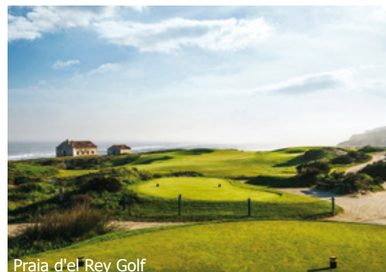
Praia d'el Rey Golf