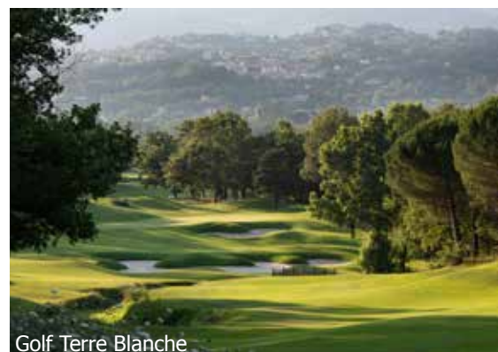
Golf Terre Blanche