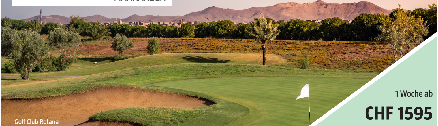
Golf Club Rotana