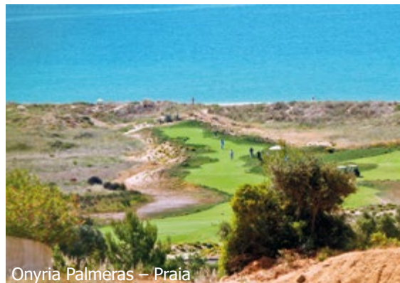
Onyria Palmeras – Praia

ab Zürich–Faro mit Edelweiss (saisonal) 70 Zürich–Lissabon m. Swiss/TAP (Fahrzeit ca. 2h40) a.A.