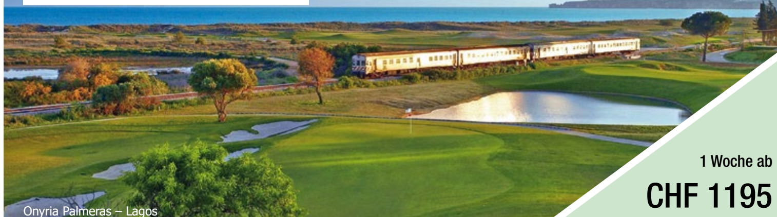
Onyria Palmeras – Lagos