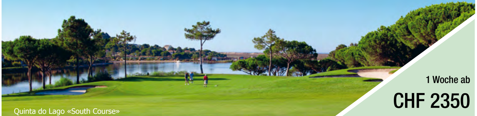
Quinta do Lago «South Course»