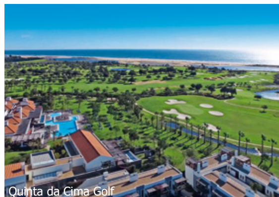
Quinta da Cima Golf