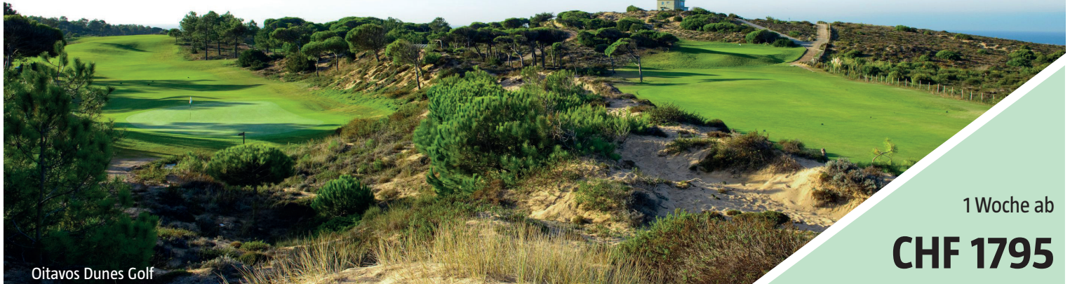
Oitavos Dunes Golf