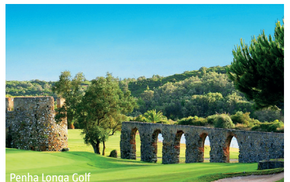
Penha Longa Golf