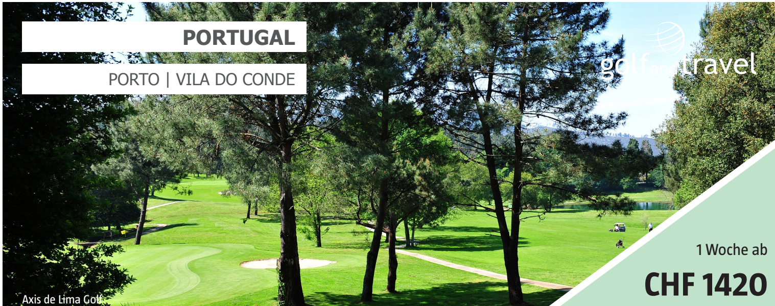
Axis de Lima Golf