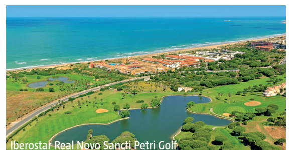
Iberostar Real Novo Sancti Petri Golf

WICHTIG: Limitierte Anzahl Flugplätze zu oben stehenden Konditionen. Ist die berechnete Buchungsklasse nicht mehr verfügbar, behalten wir uns vor, den Flugzuschlag aufzurechnen. Früh buchen lohnt sich! nb250/300