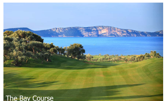
The Bay Course

WICHTIG: Limitierte Anzahl Flugplätze zu oben stehenden Konditionen. Ist die berechnete Buchungsklasse nicht mehr verfügbar, behalten wir uns vor, den Flugzuschlag aufzurechnen. Früh buchen lohnt sich! tb400