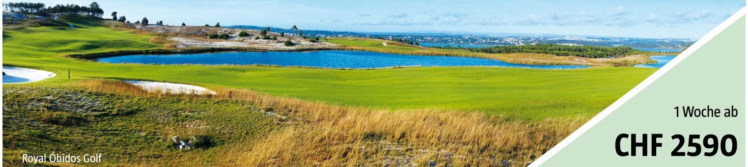
Royal Óbidos Golf