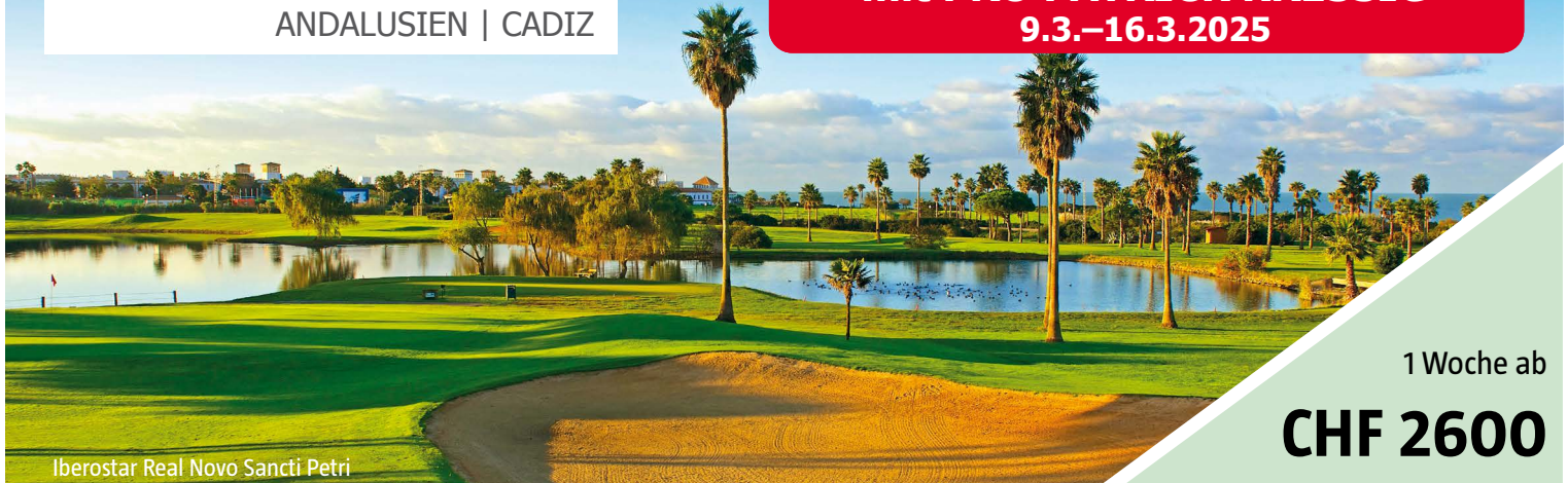
Iberostar Real Novo Sancti Petri