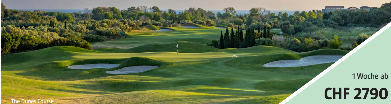
The Dunes Course

TRAININGS-GOLFWOCHEN mit SWISS PGA PRO wöchentlich 27. Februar bis 17. April 2026