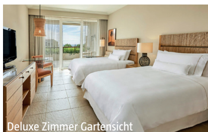
Deluxe Zimmer Gartensicht

Zimmer: 445 Deluxe Zimmer und Suiten, davon 131 mit privaten Infinity-Pools. Die Zimmer sind ausgestattet mit separater Badewanne und Duschkabine, Föhn, Bademäntel, Hausschuhe, Telefon, TV, WLAN, Safe und 24h-Zimmerservice.