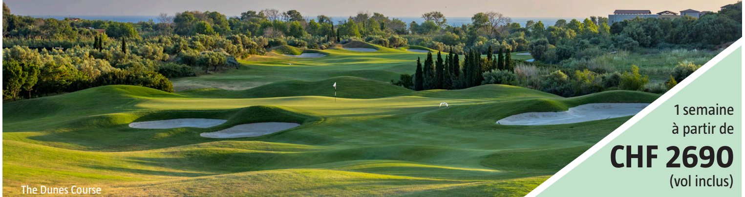
The Dunes Course