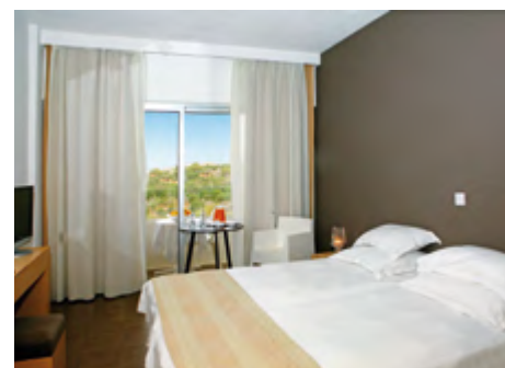
Standard Zimmer seittliche Meersicht

Gegen Gebühr: Billard, Fahrradverleih, Massage und Wellnessbehandlungen. Wassersportmöglichkeiten am Strand.