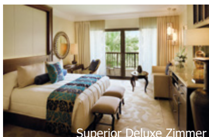
Superior Deluxe Zimmer

Sport/Wellness: «One&Only Spa», Fitnesscenter, Tennisplätze (Flutlicht), Wassersportmöglichkeiten g. Gebühr.