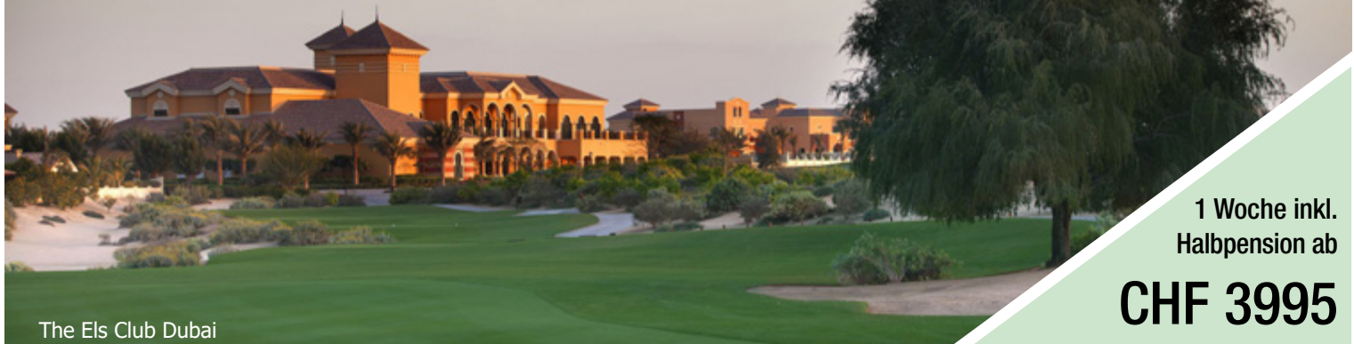
The Els Club Dubai