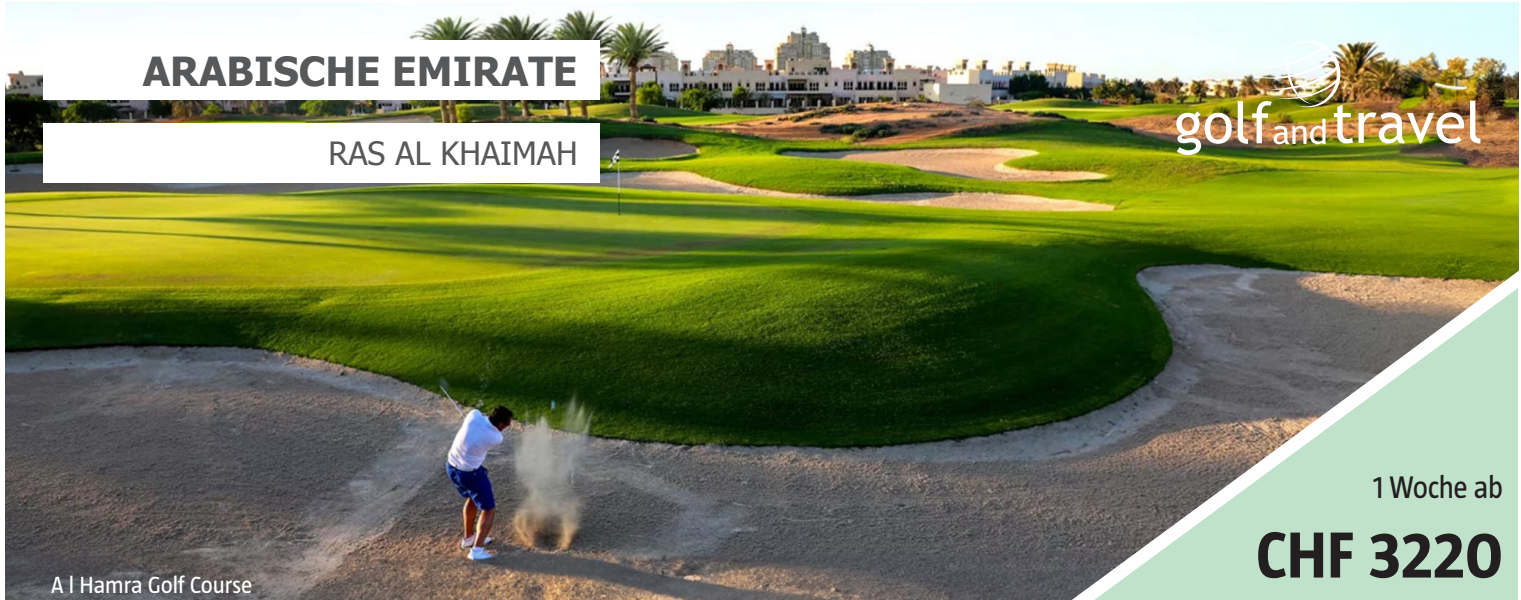
A | Hamra Golf Course