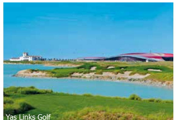
Yas Links Golf

IMPORTANT: Nombre limité de billets d'avion aux conditions ci-dessus. Si la classe de réservation calculée n'est plus disponible, nous nous réservons le droit d'ajuster une éventuelle surcharge de vol. Réserver de bonne heure vaut la peine! nb780/0