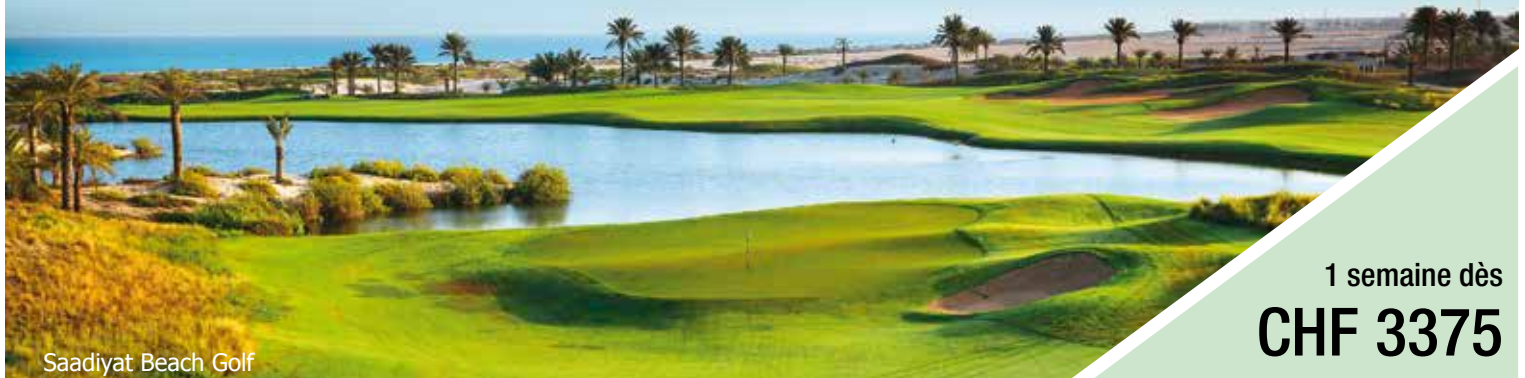
Saadiyat Beach Golf