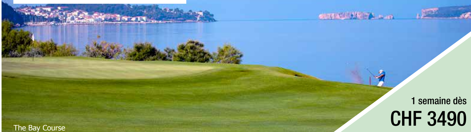
The Bay Course