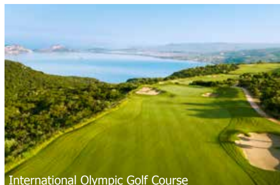
International Olympic Golf Course

IMPORTANT: Nombre limité de billets d'avion aux conditions ci-dessus. Si la classe de réservation calculée n'est plus disponible, nous nous réservons le droit d'ajuster une éventuelle surcharge de vol. Réserver de bonne heure vaut la peine! tb/liste