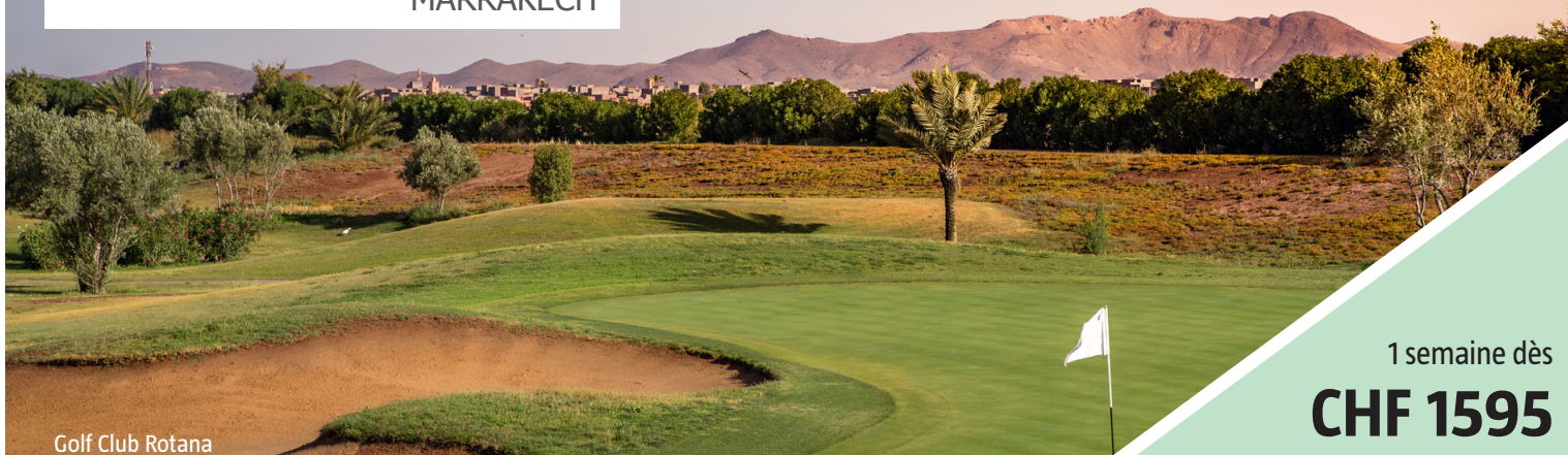
Golf Club Rotana