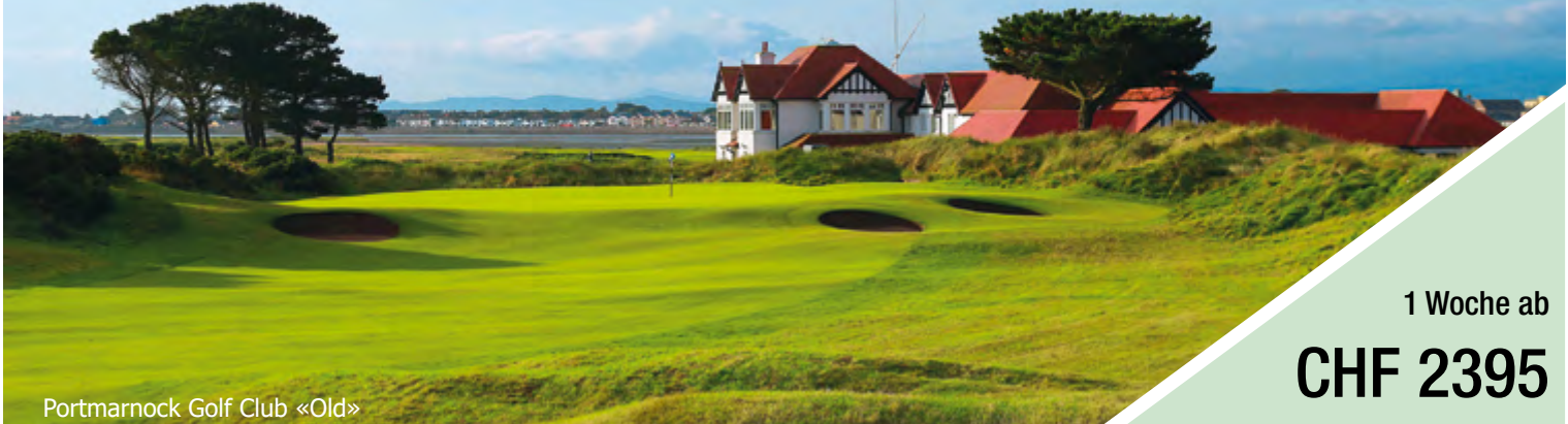
Portmarnock Golf Club «Old»