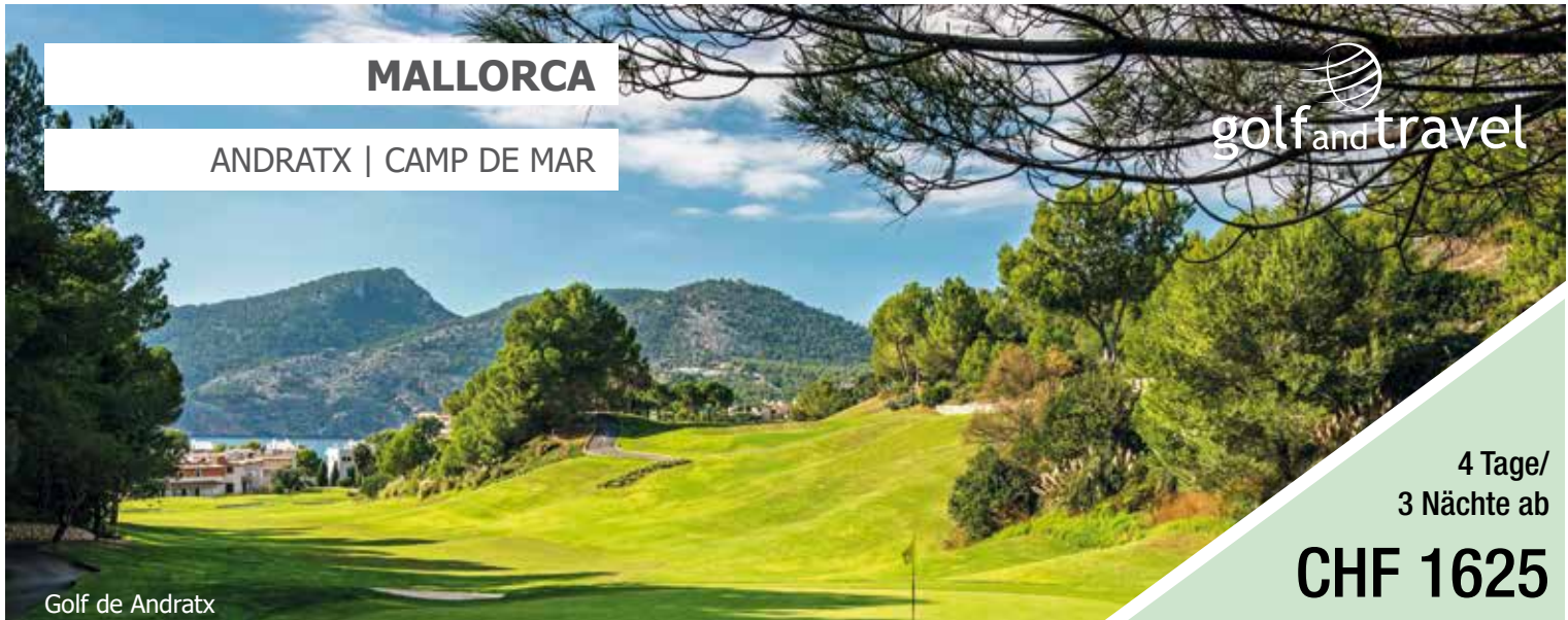
Golf de Andratx