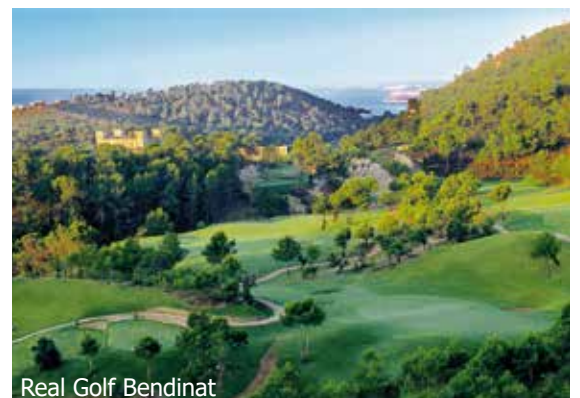
Real Golf Bendinat

WICHTIG: Limitierte Anzahl Flugplätze zu oben stehenden Konditionen. Ist die berechnete Buchungskategorie nicht mehr verfügbar, behalten wir uns vor, den Flugzuschlag aufzurechnen. Früh buchen lohnt sich! ar250/300