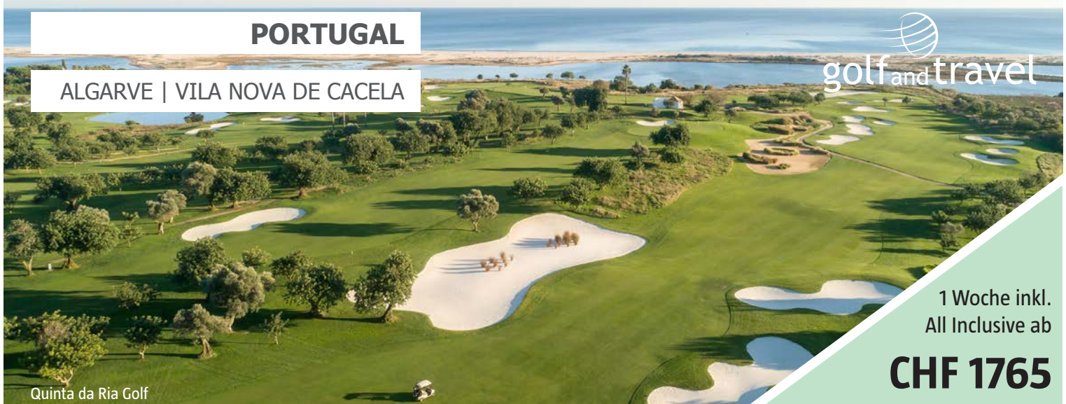
Quinta da Ria Golf