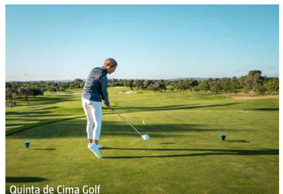
Quinta de Cima Golf

Edelweiss ab Zürich ab 125 Zürich–Sevilla mit Edelweiss inkl. Transfer a.A. (ca. 1Std. 50 Min. Fahrzeit zum Hotel)