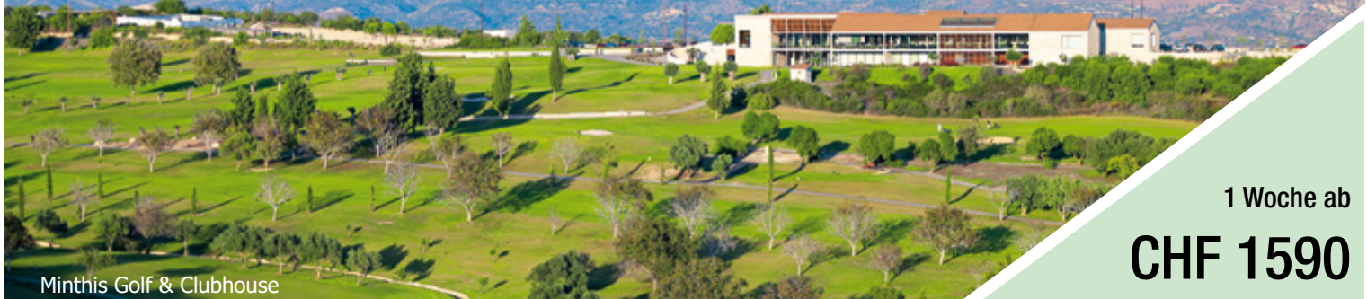
Minthis Golf & Clubhouse