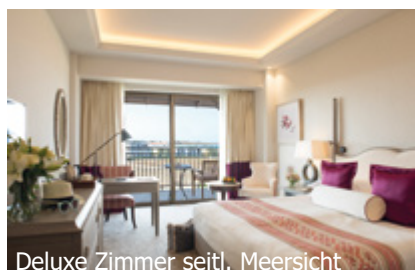
Deluxe Zimmer seitl. Meersicht

WICHTIG: Limitierte Anzahl Flugplätze zu oben stehenden Konditionen. Ist die berechnete Buchungsklasse nicht mehr verfügbar, behalten wir uns vor, den Flugzuschlag aufzurechnen. Früh buchen lohnt sich! d_2tb300