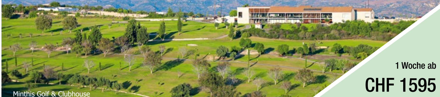
Minthis Golf & Clubhouse