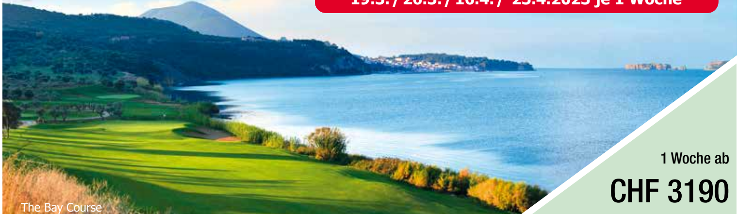
The Bay Course