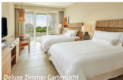
Deluxe Zimmer Gartensicht

Sport/Wellness: Anazoe Spa, Massagen, Whirlpools, Sauna, Hallenbad, Fitnessraum, Fahrrad- und Bootsverleih, Wassersport, Tauchkurse.