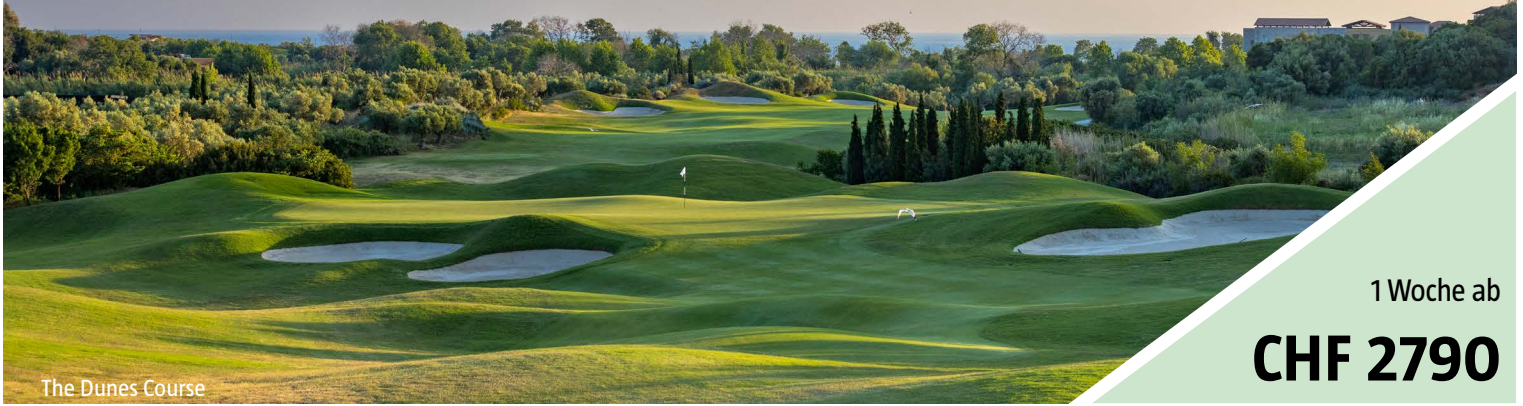
The Dunes Course

TRAININGS-GOLFWOCHEN mit PGA Pros Gregor Kotnik und Tobias Möser 8. bis 15. November 2024